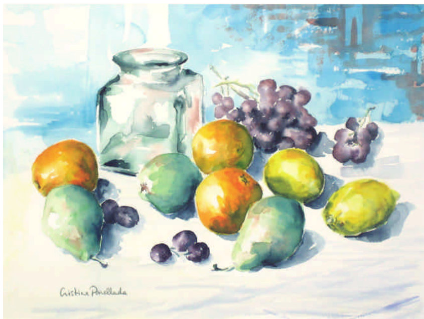
Cristal, frutas y limones (Colección Bodegones), 31x41 cm.