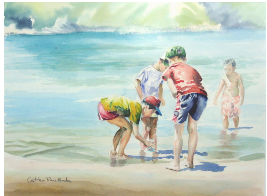
La pesca del cangrejo (Colección Figuras), 31x41 cm.